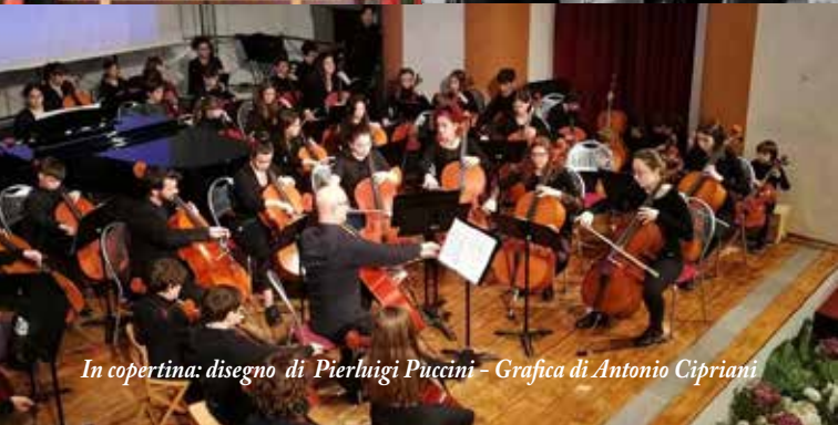
In copertina: disegno di Pierluigi Puccini - Grafica di Antonio Cipriani