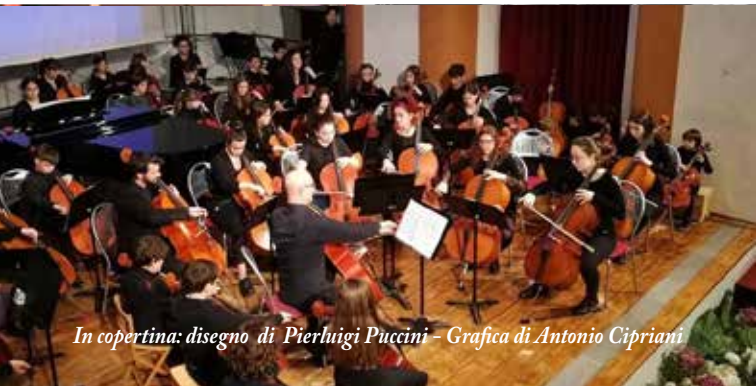
In copertina: disegno di Pierluigi Puccini - Grafica di Antonio Cipriani